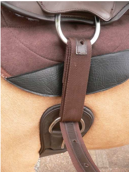
Abbildung Schritt 4