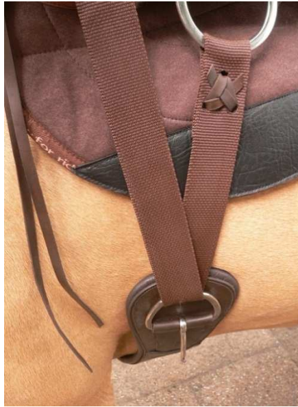
Abbildung Schritt 2