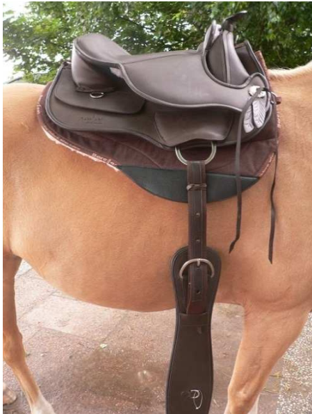
Abbildung Schritt 1