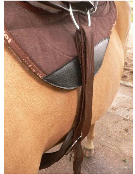
Abbildung Schritt 3