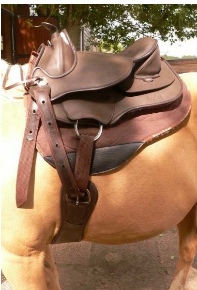
Abbildung Schritt 7

Schritt 1: Sattel auflegen und den Westerngurt auf der rechten Seite mit dem Off-Billet befestigen.